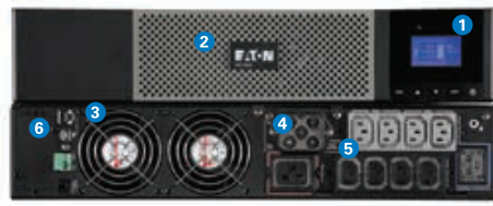
Eaton 5PX 3000i RT2U